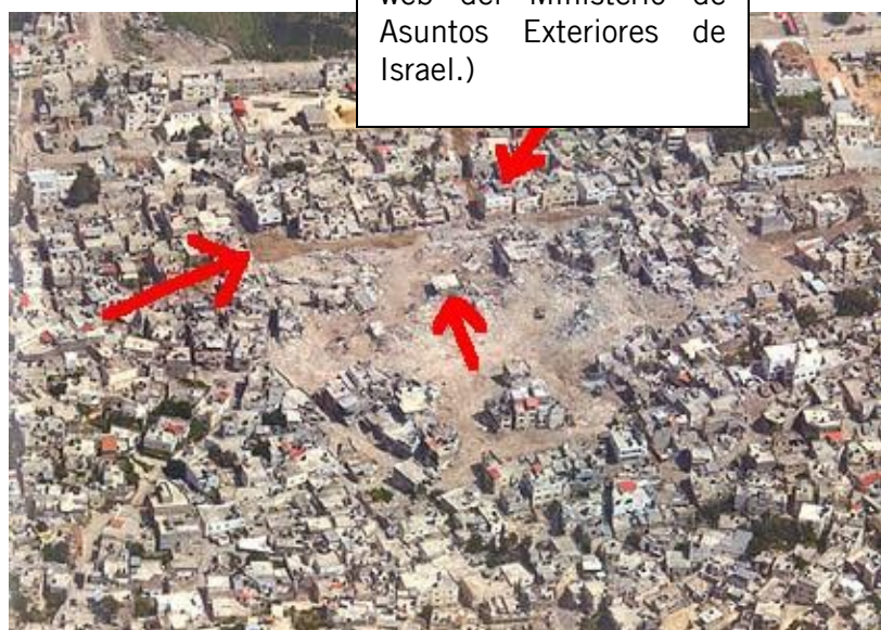
Campo de refugiados de Yenín, 13 de abril de 2002

Las fechas trazadas sobre estas fotografías aéreas del campo de refugiados de Yenín muestran la superficie del barrio de Hawashin que fue demolida entre el 11 y el 13 de abril de 2002, cuando, según informes, habían acabado ya los combates.