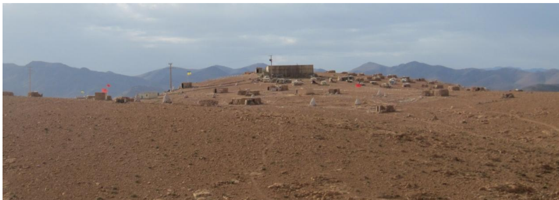
Bassin d'eau de la SMI sur le mont Aleban et campement des habitants d'Imider

Afin d'appuyer leurs revendications, les habitants ont commencé à organiser des sit-in réguliers devant la mine puis devant le siège de la commune de Imider. Parallèlement, des discussions ont été entamées entre le comité représentant les habitants (désigné par l'Agraw) et le représentant de la SMI. Trois semaines après, aucune des revendications des habitants n'a été entendue par la firme qui exploite la mine d'argent. En conséquence, les habitants de Imider ont décidé d'utiliser un nouveau moyen de pression : couper l'eau qui alimente la mine. C'est ce qu'ils ont pu faire mais pour un seul point d'eau, celui qui se trouve sur le mont Aleban situé à deux kilomètres à l'est de Imider, les autres puits étant gardés par l'armée. Depuis le 23 août 2011, ils ont installé un campement permanent sur le mont Aleban et gardent fermée la vanne d'eau qui s'y trouve.