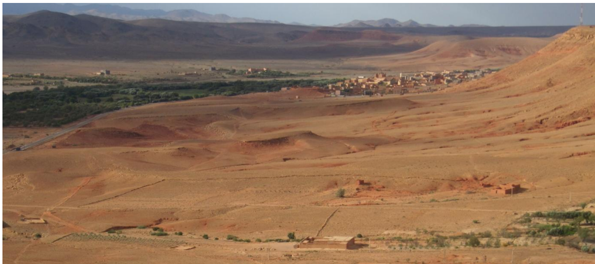
Le village de Imider, vue générale

Imider est une petite commune posée au pied du Haut-Atlas, à quelques 300 km au sud-est de Marrakech, entre Tinghir et Boumaln-N-Dadès, sur la N10, l'axe routier reliant Warzazat à Errachidia. C'est une zone désertique parsemée de petites localités dont l'existence est intimement liée à la présence de l'eau. Environ 5000 habitants vivent dans les 7 villages de cette commune (Ait-Mhend, Ait-Ali, Ait-Brahim, Anou N Izem, Izoumken, Taboulkhirt et Ikis), essentiellement de l'activité agricole vivrière (maraichage et petits élevages). Les habitants de cette région sont des Amazighs.