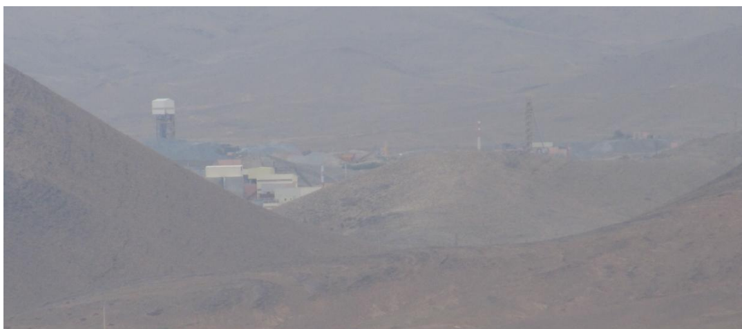
Installations de la mine d'argent exploitée par la SMI, à 3 km de Imider

Depuis 1969, la Société Métallurgique de Imider (SMI) exploite un gisement d'argent sur les terres collectives des habitants de Imider, puise dans la nappe phréatique l'eau nécessaire au traitement du minerai, rejette des polluants et n'apporte aucun avantage pour la population locale, pas même l'emploi des jeunes au chômage. Ces dernières années, les paysans de Imider ont constaté le recul des niveaux d'eau très inquiétants, de près de 60%, jusqu'à rendre inexploitable certaines parcelles productives jusque-là. Des champs d'arbres fruitiers ont ainsi été perdus faute d'eau. D'après les constats, l'appauvrissement de la ressource hydrique est due au pompage excessif effectué par la SMI. Plusieurs canalisations partent de plusieurs puits et convergent vers la mine qui consomme de grandes quantités d'eau. La mine utiliserait 1555 m 3 d'eau par jour, soit plus de 12 fois la consommation journalière de tous les habitants de Imider. Si la situation devait perdurer, elle menacerait directement la vie dans cette localité.