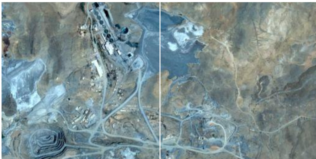
La mine, vue aérienne