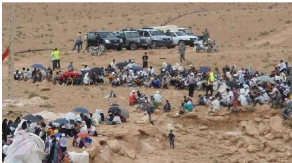
Sit-in de la population sur le mont Aleban sous la surveillance des gendarmes et du personnel sécurité de la SMI.

Au cours du mois d'octobre 2012, une autre tactique a été utilisée par les autorités locales de Imider et Tinghir en collaboration avec la direction de la SMI, afin de casser le mouvement de protestation qui est resté ferme et uni malgré 15 mois de résistance dans des conditions très hostiles. Les représentants de l'autorité de l'Etat et ceux de la firme SMI ont eux-mêmes choisi de faux-représentants des habitants et ont fait mine d'entamer avec eux un pseudo-