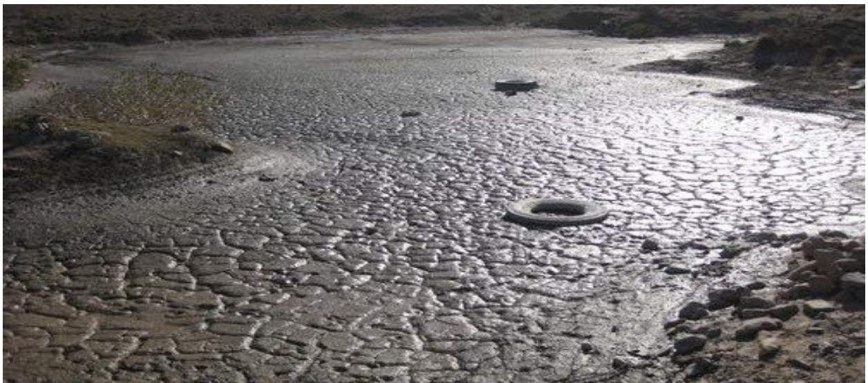
rejet de l'eau polluée par la mine