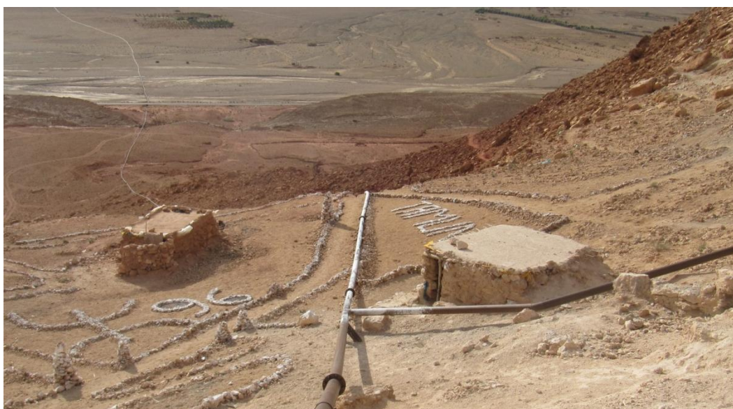
Canalisations acheminant l'eau vers la mine