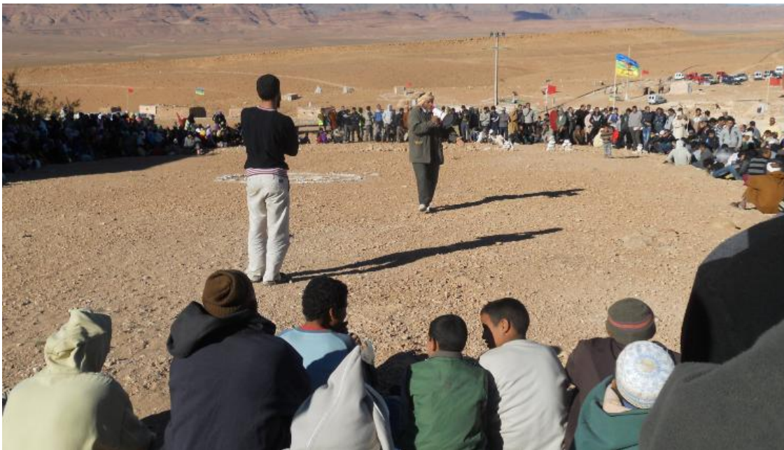
Agraw, l'assemblée des habitants de Imider

Prenant conscience des conséquences néfastes des conditions d'exploitation de la mine, les habitants de Imider se sont réunis le 1/08/2011 pour réclamer une étude scientifique indépendante sur les externalités négatives produites par la mine, la mise en place par la SMI de dispositifs capables de réduire la pollution, réduction de la quantité d'eau consommée par la mine, investissement d'une part des bénéfices dans la création d'infrastructures sociales et l'embauche prioritaire des chômeurs locaux. La question de la illégalité de l'occupation des terres collectives par la mine a également été posée.