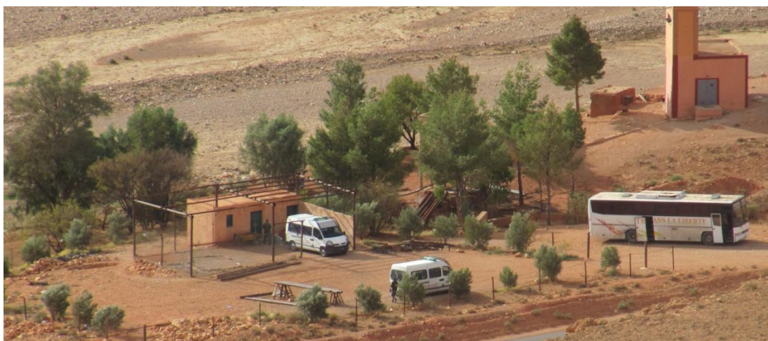
Un des puits alimentant la mine, gardé par les soldats de l'armée royale marocaine

De nouvelles réunions ont eu lieu entre les représentants de l'Agraw et ceux de la SMI, en présence des autorités locales, mais sans résultat. A partir de ce moment, les autorités marocaines décident d'utiliser la manière forte dans le but de décourager, puis de déloger les habitants du mont Aleban et de libérer la conduite d'eau fermée.