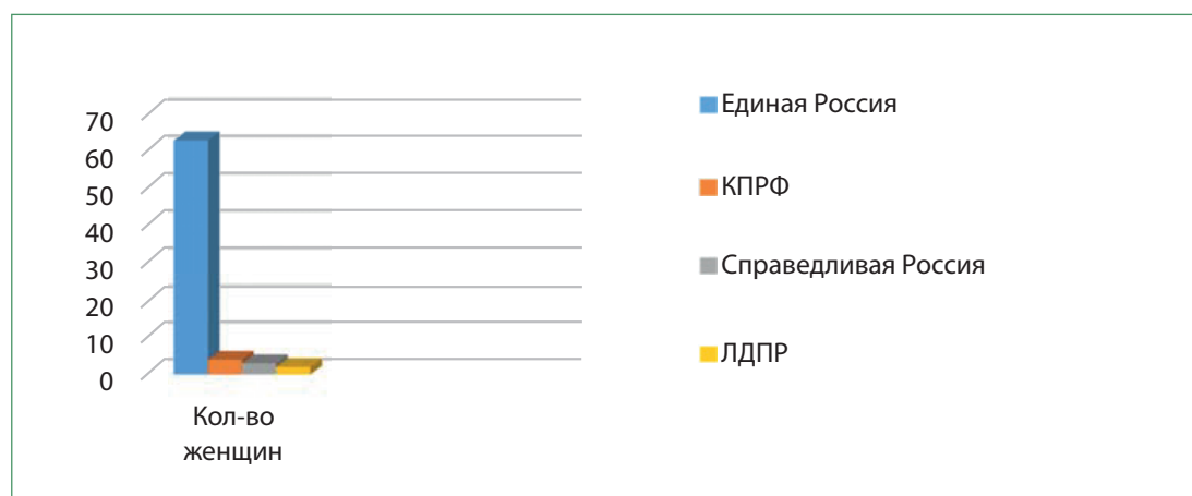
Рис. 1. Численность женщин в политических партиях Государственной Думы

На качественном уровне распределение женщин-депутатов по комитетам воспроизводит горизонтальную гендерную сегрегацию на рынке труда в Российской Федерации (см. раздел выше). Набор в парламентские комитеты и комиссии основывается на профессиональной квалификации депутата и ключевых законодательных инициативах, что еще больше усиливает гендерную сегрегацию. Женщины возглавляют 5 из 26 (19%) комитетов Госдумы: по культуре, по экологии и охране окружающей среды, по жилищной политике и жилищно-коммунальному хозяйству, по регламенту и организации работ Государственной Думы, а также по вопросам семьи, женщин и детей.