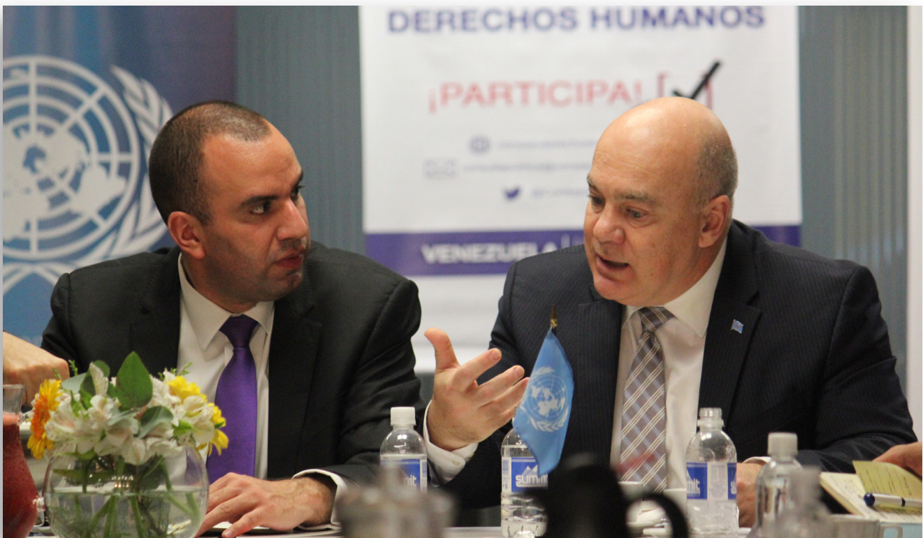
Consulta pública con Agencias del Sistema de Naciones Unidas acreditadas en Venezuela. Caracas, 21 de julio de 2015.