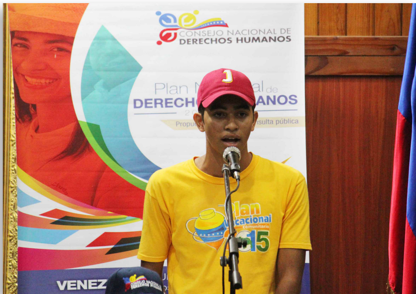
Consulta pública con adolescentes. Aragua, 24 de agosto de 2015.