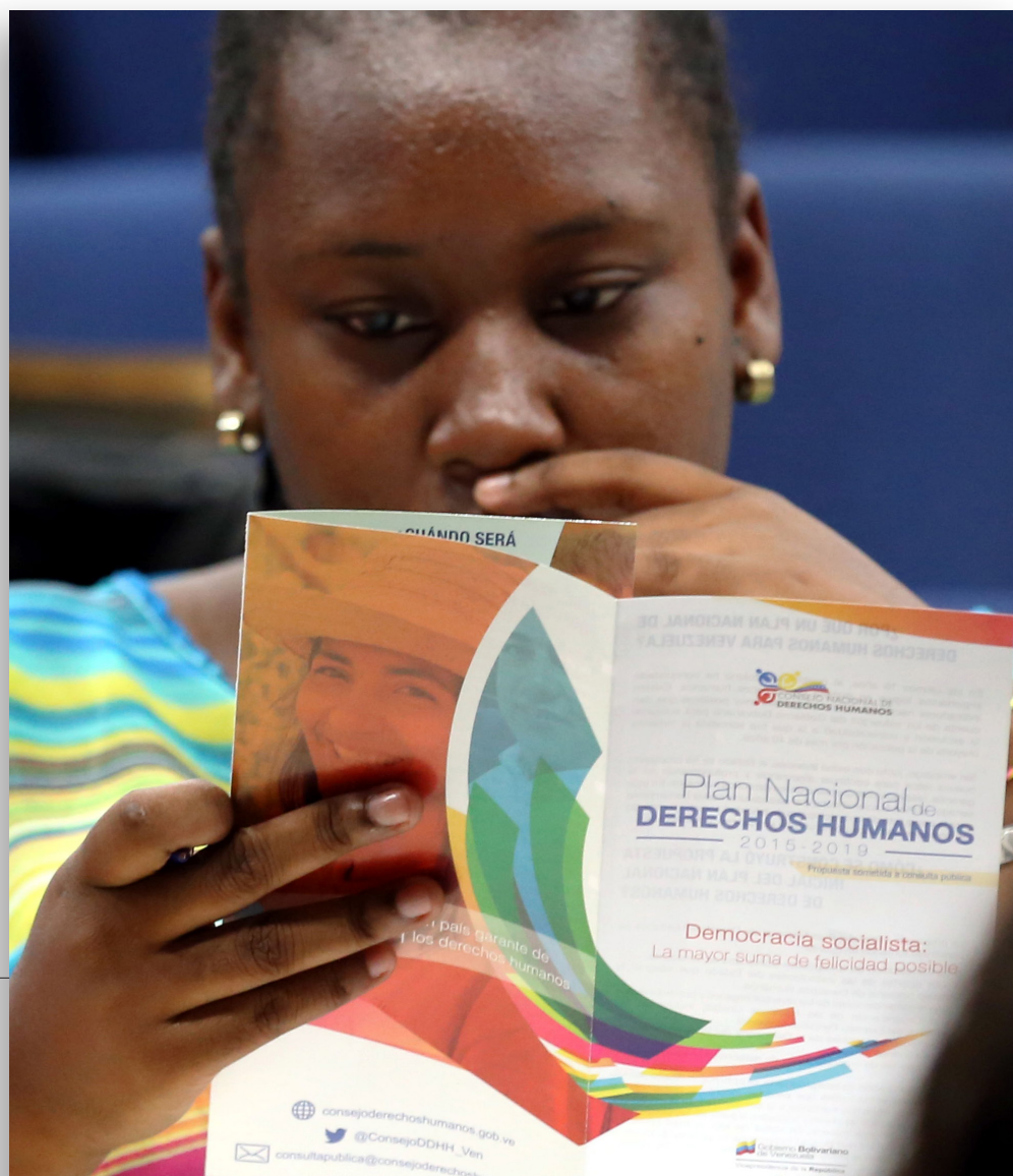
Consulta pública con movimientos afrodescendientes. Caracas, 14 de agosto de 2015.