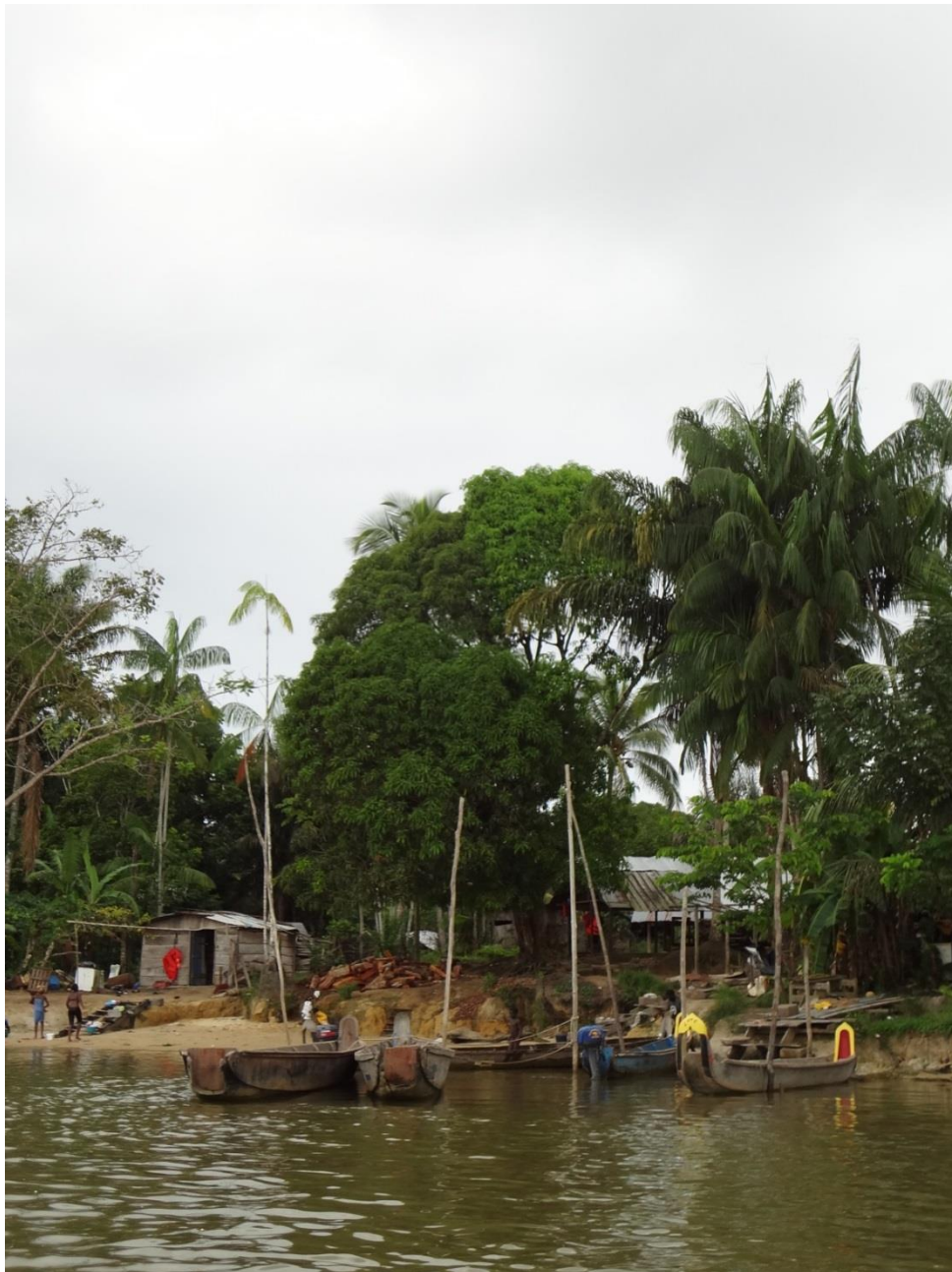
Village bushinengué sur le Maroni