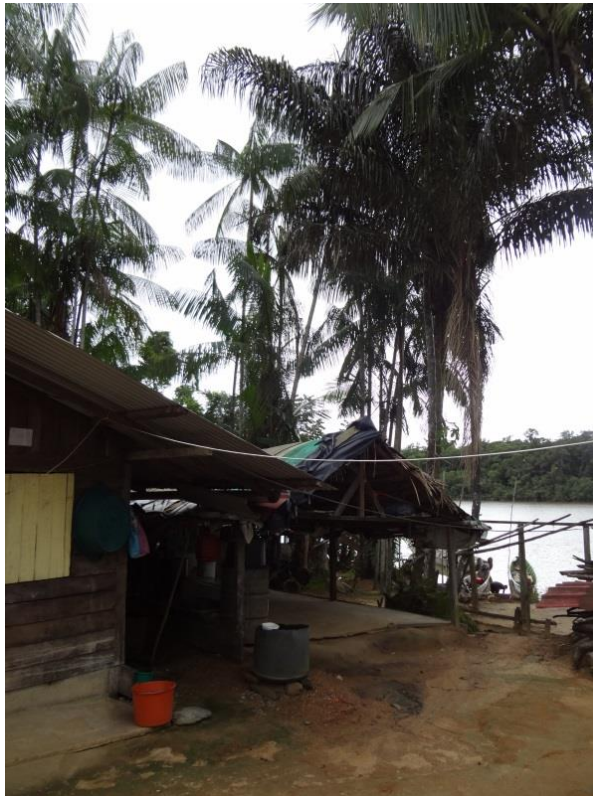
Village Bushinengué sur Ile Portal